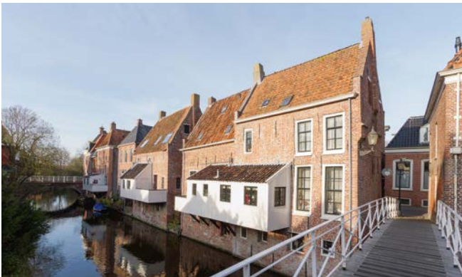
Huizen met hangerkers aan het Damsterdiep in Appingedam. M. Sekuur 2011

Naast glas zijn de belangrijkste bouwmaterialen bij historische erkers natuursteen, baksteen, hout en ijzer – vaak in combinatie – en daarbij nog koper, lood en zink voor de afdichting en de dakbedekking. Leien en dakpannen komen vanwege de beperkte